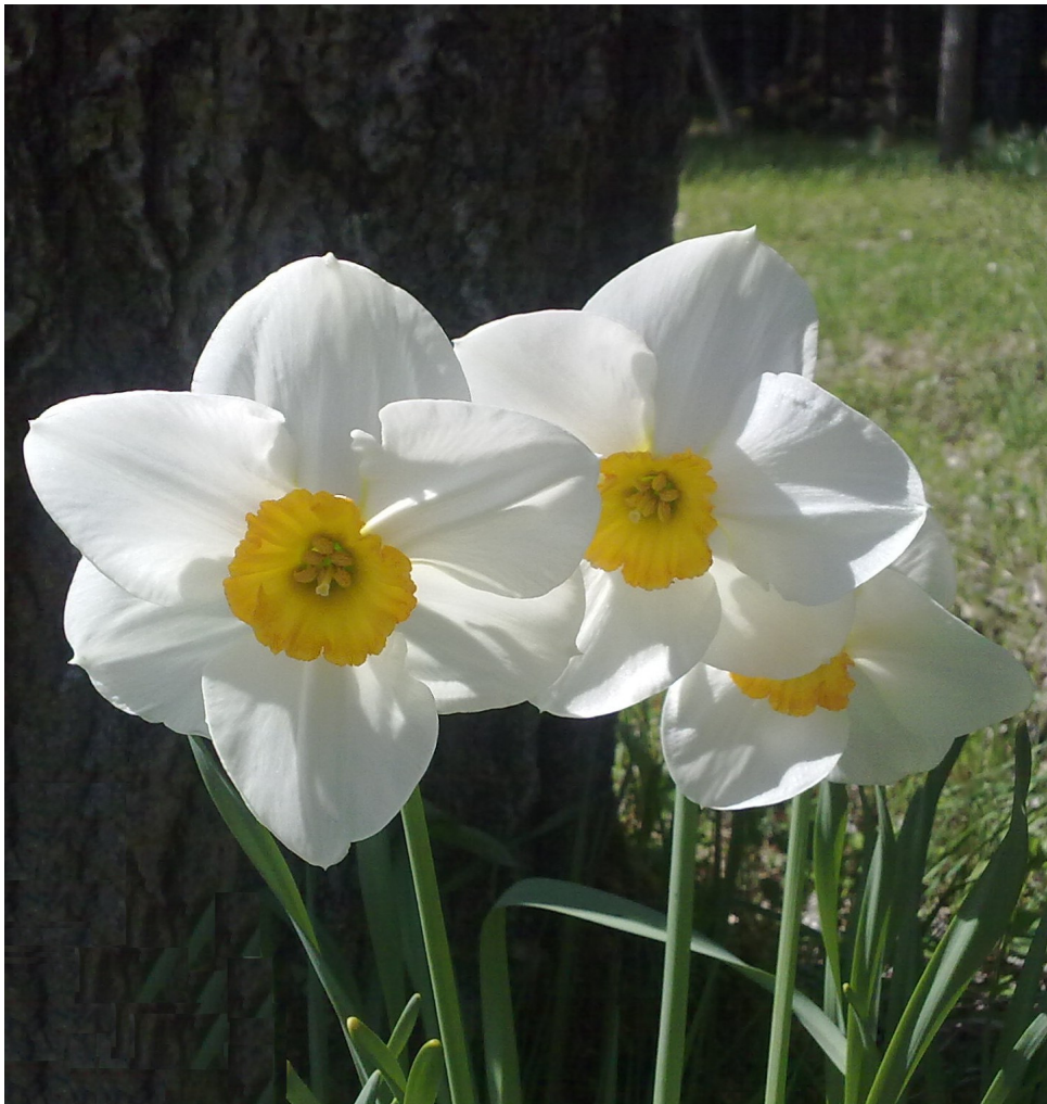
Valo voittaa, pimeys katoaa.