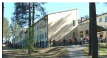
Laukaan koulu ja lukio.

Noin 20 km Jyväskylästä pohjoiseen sijaitseva Laukaa ja Sydän-Laukaan koulu ja lukio sekä niiden yhteydessä oleva ilmava liikuntahalli muodostavat ensi kesän valtakunnallisen Kristus-juhlan pitopaikan. Koulu ja liikuntahalli ovat lähellä Laukaan keskustaa, os. Saralinnantie 3. Tilaisuudet pidetään liikuntahallissa ja ruokailut sen yhteydessä olevassa koulun ruokailusalissa. Kaikki saman katon alla.